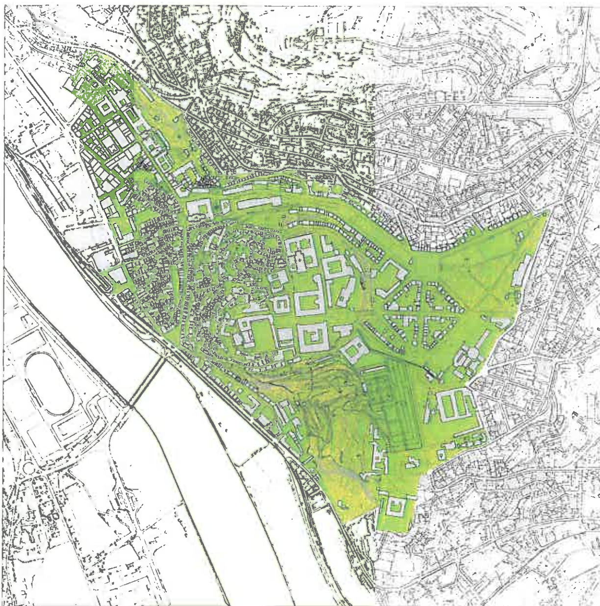
Carta nº 1 - Planta da Área afectada ao Regulamento