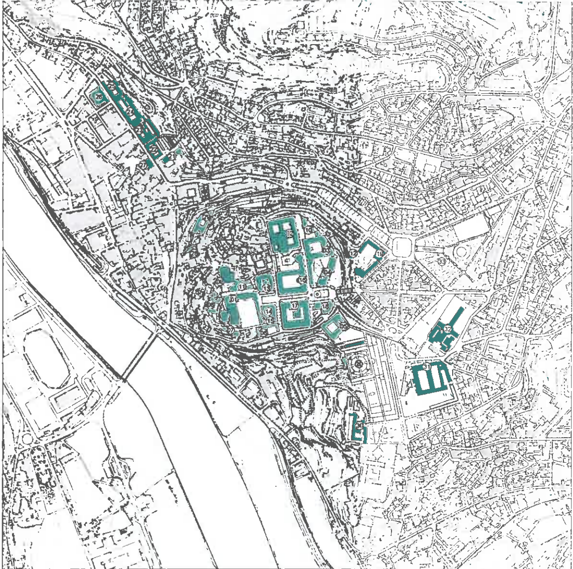
Carta nº 4 - Planta de Identificação dos Edifícios